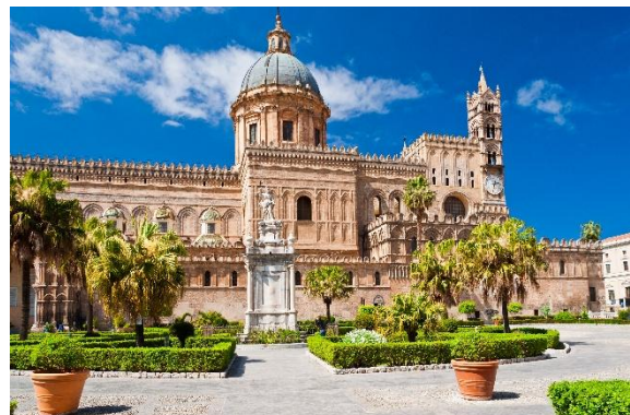
Kathedrale von Palermo